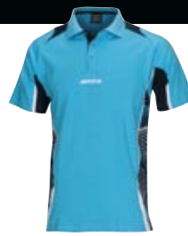
302291 aqua blau_navy_weiß