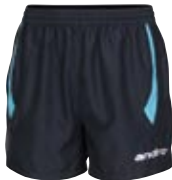
312230 navy_aqua blau