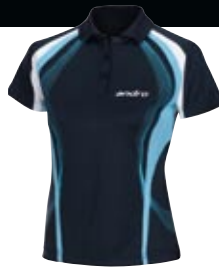
302250 navy_aqua blau_weiß