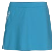
322207 aqua blau