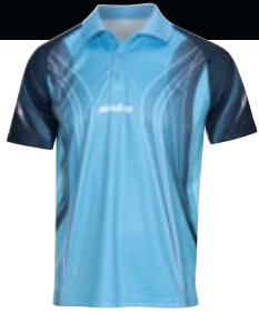
302273 aqua blau_navy