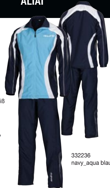
332236 navy_aqua blau