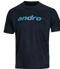
302253 navy_aqua blau