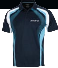
302288 navy_aqua blau_weiß